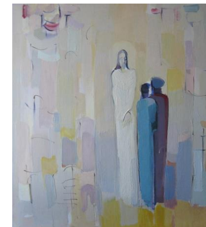
Na putu za Emaus