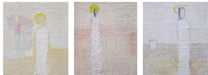
Tri realizacije teme Uskrsnuli Krist