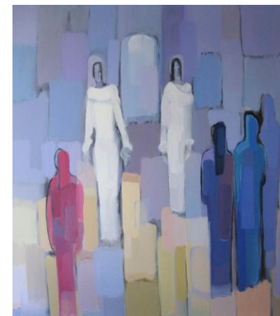
U jutro Uskrsa