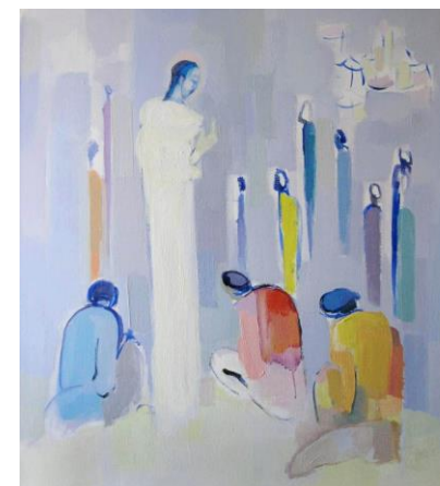
Ustanite, ne bojte se