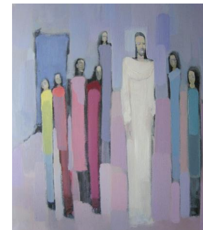
Ja sam s Vama