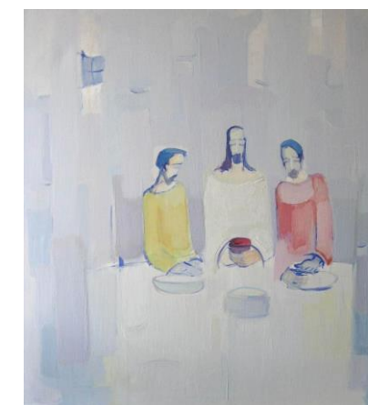
Večer u Emausu