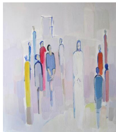
Ne bojte se, Ja sam