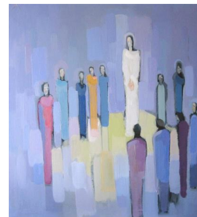
Ja sam, ne bojte se