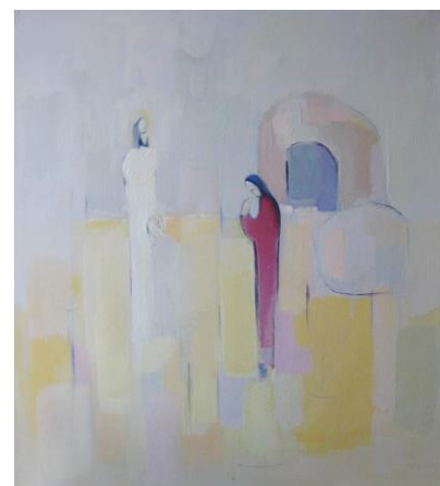
Susret (Na Uskrsno jutro)