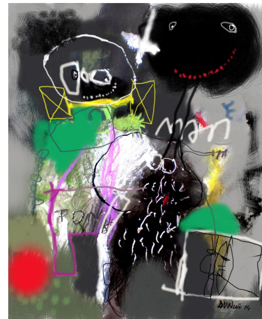
Tunga Bunga Blues