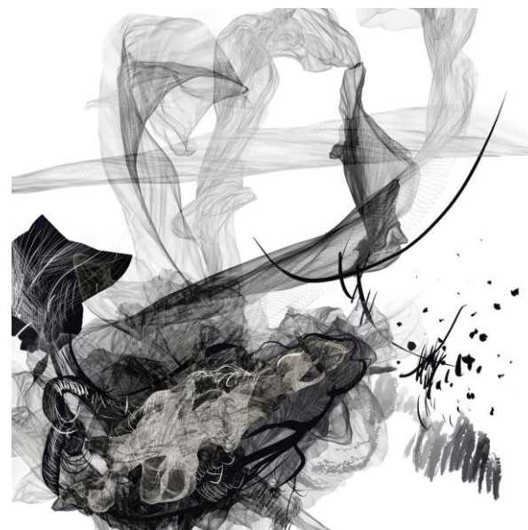
Crtež, digitalni ispis, 2022.