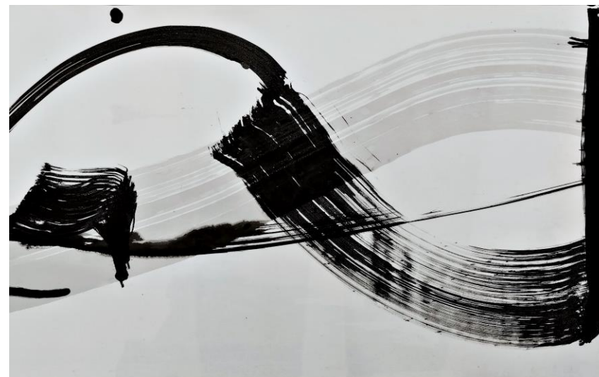
Zapis, lavirani tuš na platnu, detalj rada, 2022.

Doktorski studij upisuje u akademskoj 2021./2022. godini na Akademiji likovnih umjetnosti Sveučilišta u Mostaru. Godine 2023. započinje izradu doktorskog rada u umjetničkom području, polje likovne umjetnosti, grana slikarstvo, s temom Crtež kao medij izricanja transcendentnog u suvremenoj umjetnosti pod mentorstvom prof. dr. art. Silve Radić.