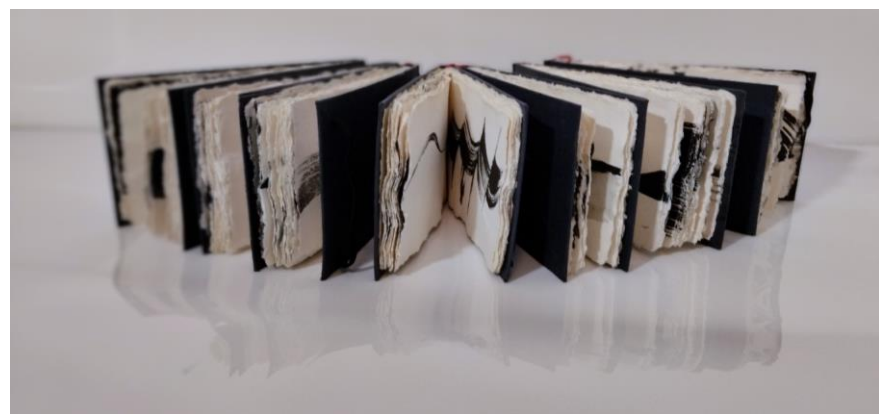
Crtački dnevnici, tuš na papiru, 2023.

Abstract: The purpose of this research paper is to examine the role of drawing in contemporary art, focusing on the unique qualities of drawing as a medium for expressing transcendental realities. In addition to the qualitative method of narrative research established in the social-humanistic field and the funnel method used to shape the research structure, the work utilized art-based research methodologies. The work consists of five sections. Following the introduction, the first section discusses drawing as a medium, touching on its primordial nature and analysing the paradigm shift in drawing in the twentieth century. The third unit examines the relationship between artists and transcendent realities through the lenses of intuition and asceticism. Contemporary art in dialogue with the sacred is examined. In the fourth section of the dissertation, methods of artistic research through the artistic process were utilized, allowing for a holistic approach to study that was closer to the very essence of the artistic process, thus providing a deeper understanding of the process itself. Through artistic expression, the expressive potential of drawing for the transcendent was investigated. This study examines the suitability of drawing as a medium for conveying realities that transcend our sensory perception, as well as the medium's distinctive qualities, which opens up space for further theoretical and artistic research.