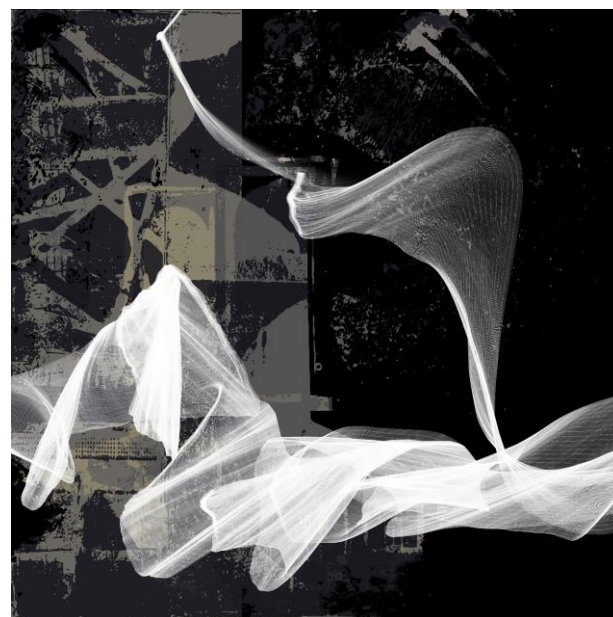
Venecija, digitalni ispis, 2023.