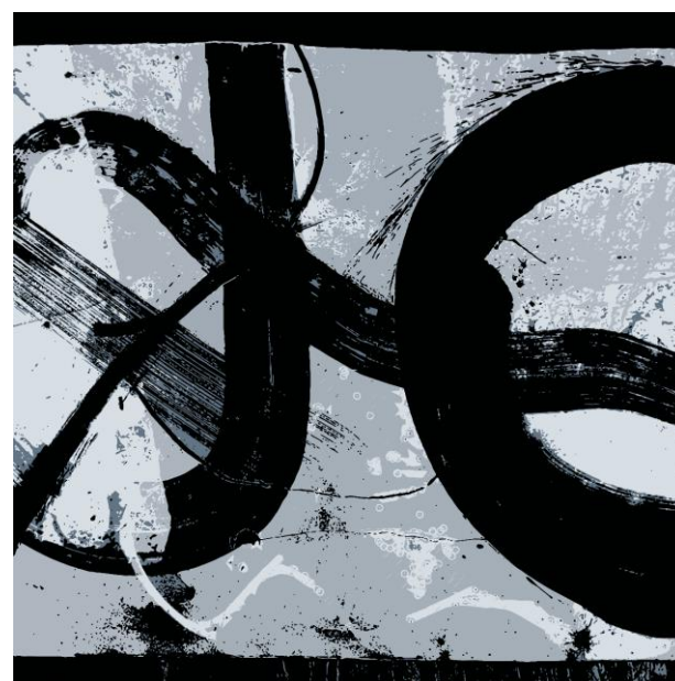
Kontinuum, digitalni ispis, 2023.