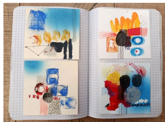
DNEVNIK BETLEHEMSKE ZVIJEZDE