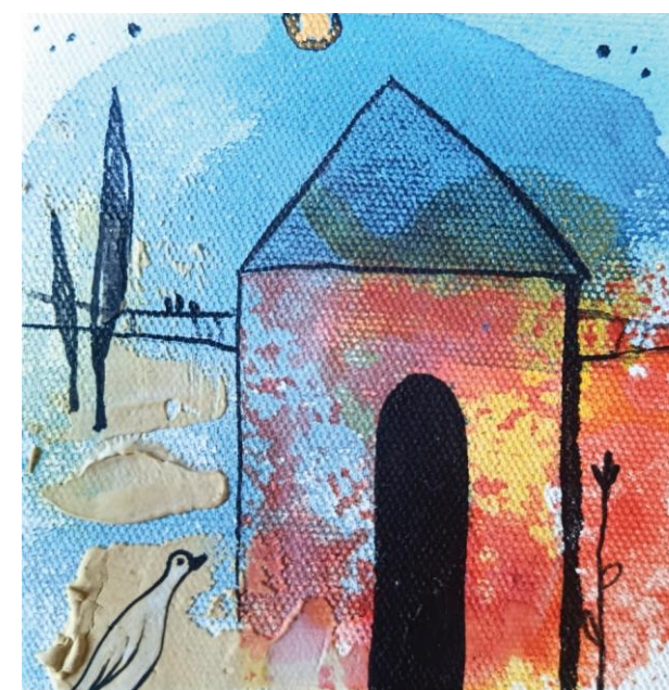
SLIKE IZ CIKLUSA DISERTACIJE – SV. OBITELJ